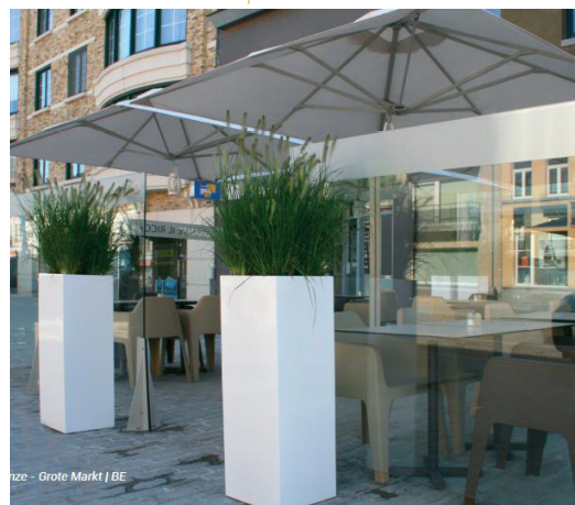
Paravents non amovibles