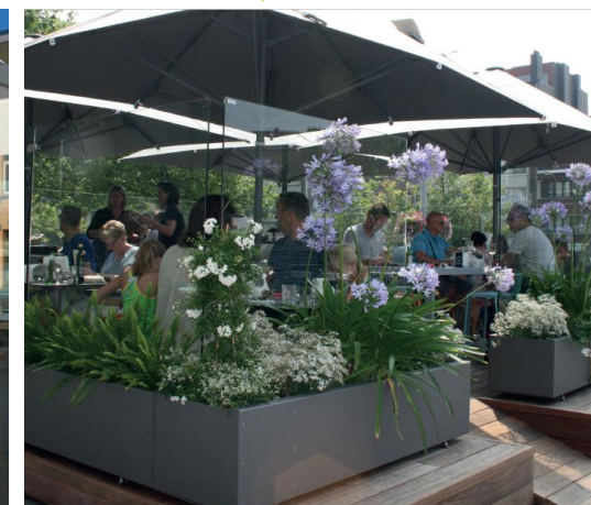
Paravents non amovibles