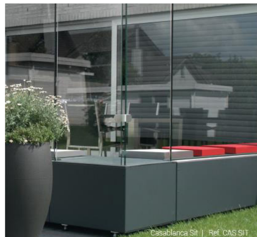
Paravents non amovibles avec assises