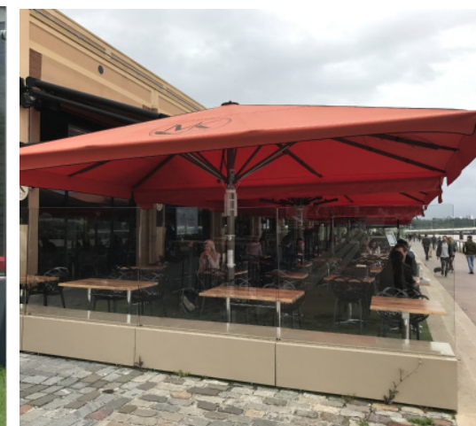
Paravents non amovibles avec assises