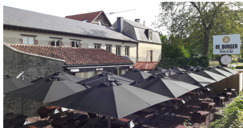
Exemples de Parasols multi-mâts